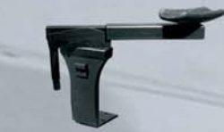
PIETRO-käsituki Sopii käsinoja LOV:iin

Valittavanas on useita käsinoja, käyttötarkoituksen ja tarvittavien ominaisuuksien mukaan. Autamme valinnassa.