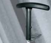
COFE-käsinoja 3000-sarjan tuoleihin